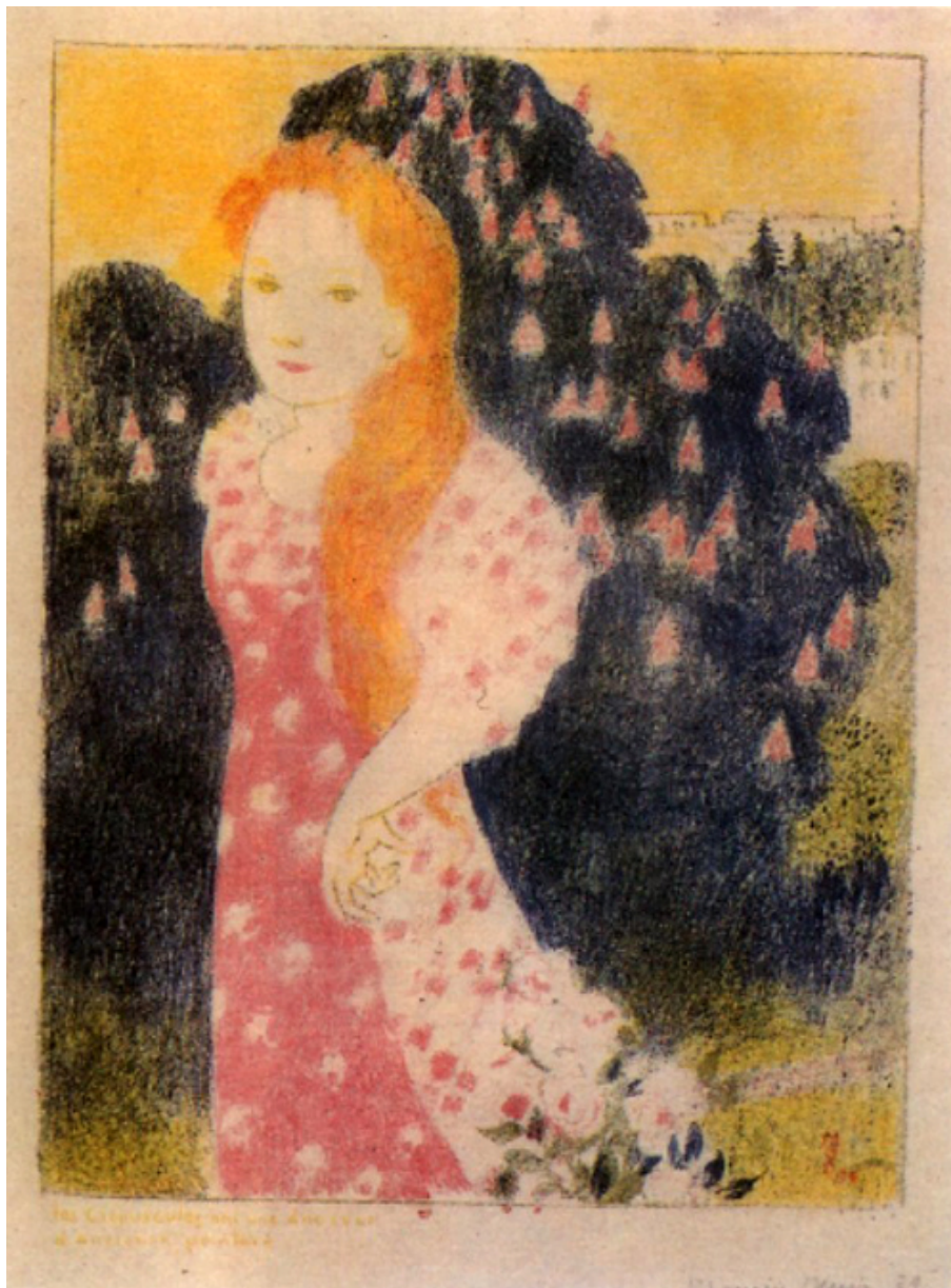
Maurice Denis, Les Crépuscules ont une douceur d'ancienne peinture, lithographie pour Amour.